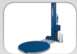
ROTOPLAT Avvolgitori a tavola rotante Turntable wrapping machines