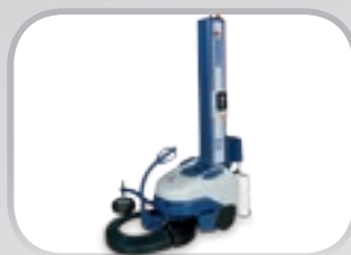
ROBOT Robot semovente Self-propelled robot

ROBOPAC's production range in packaging with stretch film is based on the following types of machines: